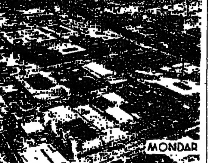
في الصورة : منظر من الطائرة لصنع « بيريلي - بيولا »

في اللجنة السياسية العاملة وتناقشت اللجنة السياسية العاملة تقريري لجنة التحقيق ، وفي ١٣ ايلول ١٩٤٧ ، وافقت اللجنة السياسية العاملة على مشروع التقسيم ، واتقررت لجنة زربية للجنة السياسية العاملة قبول مشروع التقسيم . وكانت هذه اللجنة مؤلفة من : كندا - تشيكوسلوفاكيا - غواتيمالا - بولونيا - افريقية الجنوبية - الولايات المتحدة - الاتحاد السوفياتي - اورغواي - فنزويلا . فاغراض على هذه التوجيه وفود الدول العربية الست حيث كتبت للين قد اصحبت عفوا في القضية الدولية ، وكوبوليا وافغصان وطرح اقتراح الوافقة على مشروع التقسيم على التصويت فقال اكثرية ٢٥ صوتا ضد ١٣ صوتا ، واما الدول التي عارضت التصويت ، اما الدول التي عارضت التصويت بالتصويت كعبا ، وانفقت الدول العربية وكوبا والهند وانفقتن الدول العربية وكندا وسوريا ، ووقع قرار اللجنة السياسية العاملة التي الجمعية العمومية ليضع والقرار فيه جانب التقسيم ، وشككت لجنة عملة